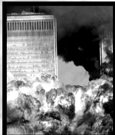
11 de septiembre de 2001

En agosto de 2001, Bayer tuvo que retirar su nuevo fármaco estrella debido a que más de 50 personas habían fallecido por tomarlo y más de 6 millones de pacientes estaban expuestos a los peligros de los efectos secundarios mortales de rhabdomiolisis (disolución del tejido muscular).