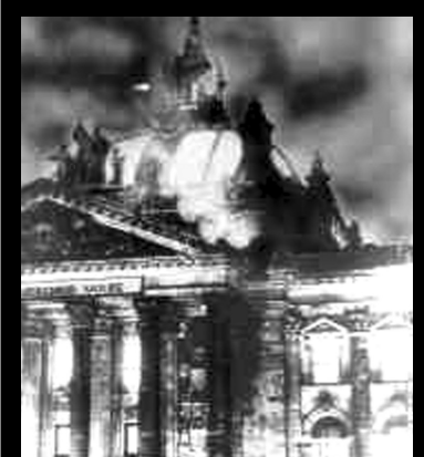
27 de febrero de 1933

En 1946/47 en el Tribunal de Guerra de Nuremberg, este Cartel fue juzgado por "conquista", "robo" y "esclavitud" y -como consecuencia- se desintegró en Bayer, BASF y Hoechst.