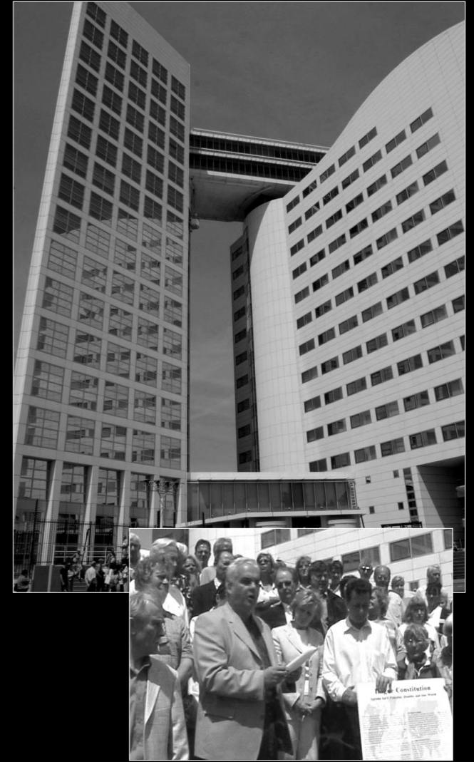
Hague'deki Birleşmiş Milletler Uluslararası Suçlar Mahkemesi

Bizimle temas kuran ve tavsiyelerimizi isteyen hükümet kurumları, kuruluşlar ve üniversitelerin bazılarının listesi aşağıdadır: